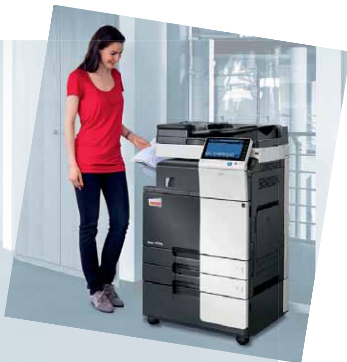
ineo 224e mit Originaleinzug (DF-624), interner Finisher (FS-533) und Großraumkassette (PC-410)