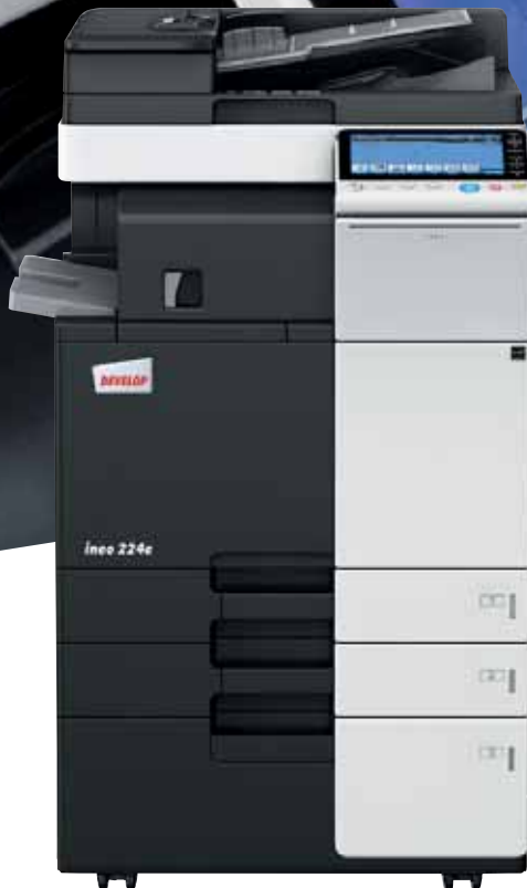
ineo 224e mit Originaleinzug (DF-624), interner Finisher (FS-533) und Großraumkassette (PC-410)