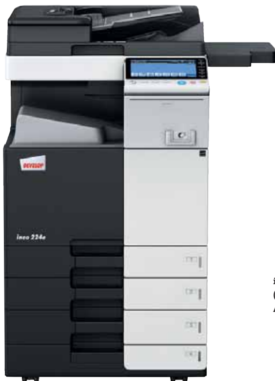
ineo 224e mit Dual Scan Originaleinzug (DF-701), Papierkassette (PC-210) und Ablagetisch (WT-506)

Jedes dieser Multifunktionssysteme – ineo 224e, ineo 284e, ineo 364e, ineo 454e und ineo 554e – ist einfach zu bedienen und hat eine große Bandbreite zusätzlicher Funktionen, die die tägliche Arbeit im Büro entscheidend erleichtern. Wenn beim Drucken, Kopieren und Scannen Zeit gespart wird, bleibt mehr Zeit für die eigentlichen Kernaufgaben – und das steigert die Produktivität im Büro.