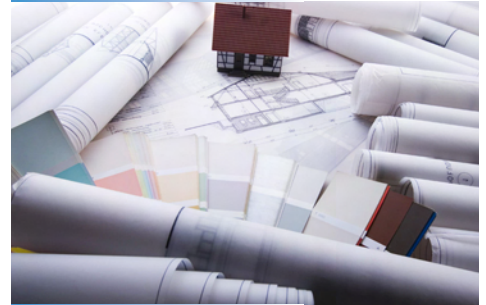
Copyshops - Repro-Dienstleister