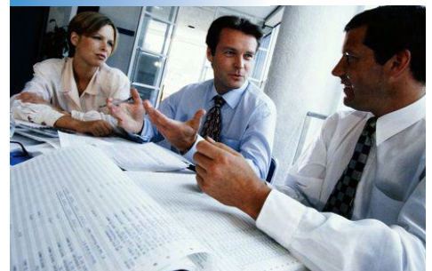
Behörden - Ämter - Kommunen