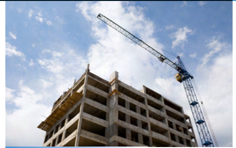
Architekten - Ingenieure - Bauunternehmer